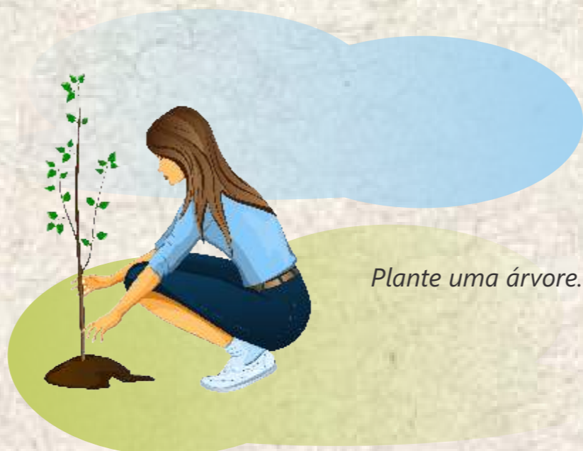
Plante uma árvore.

A preocupação com o meio ambiente é de todos! Cada um deve fazer sua parte, dentro e fora da TECNOSULFUR®.